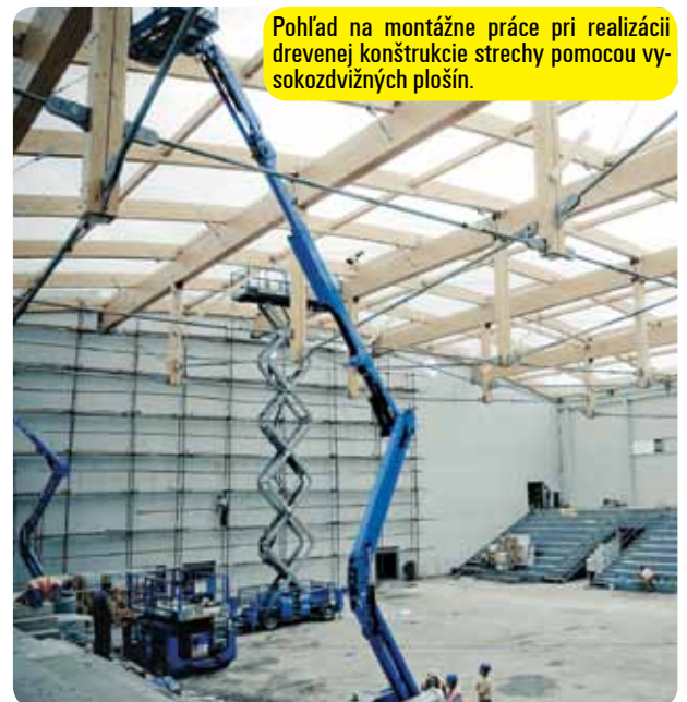
Pohľad na montážne práce pri realizácii drevenej konštrukcie strechy pomocou vysokozdvížných plošín.