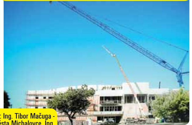
Montáž drevených strešných vazníkov pomocou mobilného žeriava FELBERMAYR s nosnosťou 400t, ktorý patrí medzi najväčšie žeriavy na Slovensku.