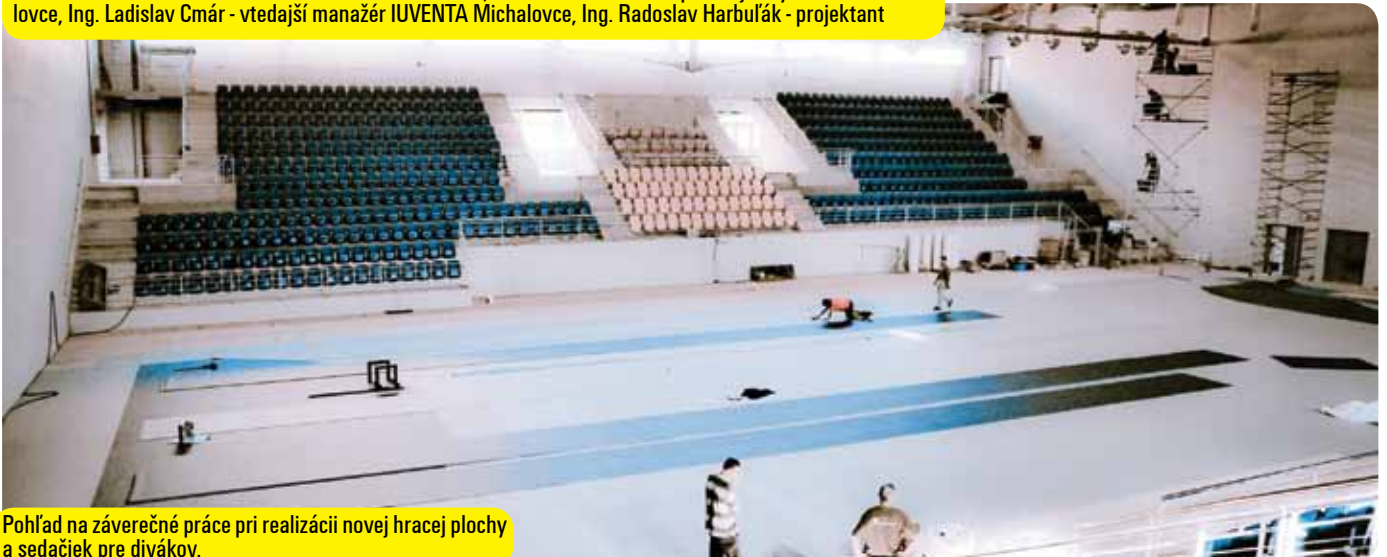
Pohľad na záverečné práce pri realizácii novej hracej plochy a sedačiek pre divákov.