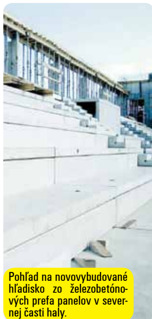
Pohľad na novovybudované hľadisko zo železobetónových prefa panelov v severnej časti haly.