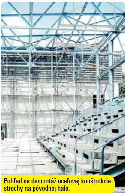
Pohľad na demontáž ocelevej konštrukcie strechy na pôvodnej hale.