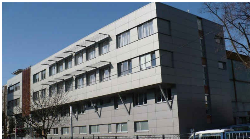
Administratívna budova spoločnosti Chemkostav, a.s.

Ja osobne mám jednoznačne jasné svoje ciele, či plány, ktoré chcem dosiahnuť, ale cesta k ich dosiahnutiu už taká jasná nie je, ha ha (smiech). Prioritne by som sa chcel venovať štúdiu cudzích jazykov, pretože tam vidím nielen svoj, ale aj firemný potenciál do budúcnosti. Bol by som rád, ak by sme do nášho kolektívu taktiež dokázali pritiahnúť aj jazykovo zdatných kolegov, za účelom vytvorenia ešte silnejšieho tímu. Verím, že sa potom jednotlivci vďaka zdravej konkurencii chytia šance a postupne po nás manažéroch, budú preberať stále väčšiu časť agendy.