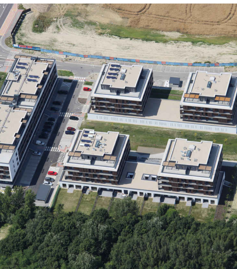
Južné Mesto Zóna C1- 2.etapa

Dá sa povedať, že z pozície prípravárky naozaj veľmi detailný. Či už ja alebo moji kolegovia, totiž sprevádzame stavbu od samého začiatku až po úplný koniec. Najprv pripravujeme výber subdodávateľov, neskôr kalkuláciu. V priebehu výstavby spolupracujeme so stavbyvedúcim, zúčastňujeme sa kontrolných dní stavby a spracovávame zmenové konania. Na a na záver po ukončení projektu vyhod-