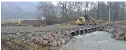
Rýchlostná cesta R2 Zvolen východ - Pstruša