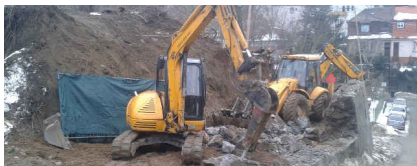
Apartmánový dom, Majakovského ulica, Bratislava