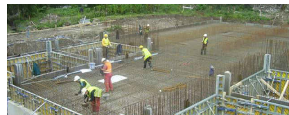
SKK Ružomberok a ČOV Liptovská Teplá, Liptovské Sliače