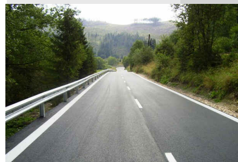
Odstránenie havarijného stavu na ceste II/535 Mlynky