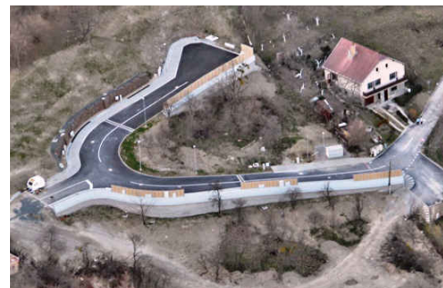
Technická infraštruktúra pre IBV Červený Breh

Podcenenie zdanlivo malej stavby sa rozhodne nevypláca. Bohužiaľ sme sa o tom museli presvedčiť na vlastnej koži, pri zdanlivo jednoduchom projekte Technická infraštruktúra pre IBV Červený Breh. Manažment celej stavby nebol optimálny, čo viedlo až k nedodržaniu termínu odovzdania. Vo firme to nezostalo bez reakcie a zo strany akcionárov spoločnosti, to spustilo vlnu detailnej analýzy vnútorných procesov. Po ich vyhodnotení to malo aj personálne následky.