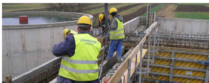
Snina - ČOV - zvýšenie kapacity