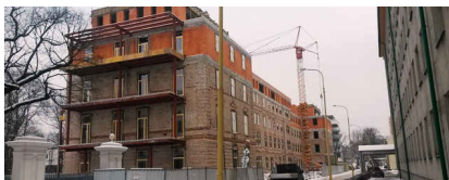
Šafranová záhrada - Rekonštrukcia veliteľskej budovy