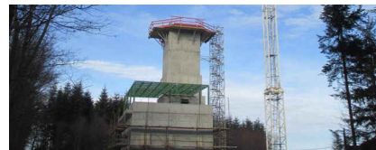
Technologický objekt pre letecké navigačné služby, Mošník, Slanské vrchy