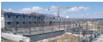
Výstavba a rekonštrukcia objektov v komplexe vážnica – nápravne zariadenie IDRIZOVO