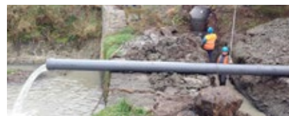
Čistá řeka Bečva II-A