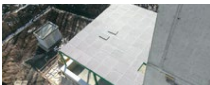
Technologický objekt pre letecké navigačné služby, Mošník, Slanské vrchy