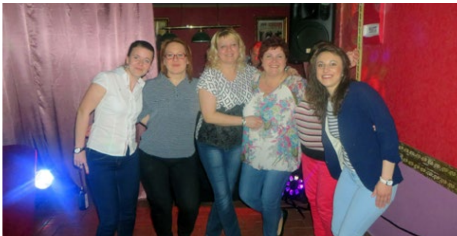
Spoločenský večierok po vyhodnotení

posúdiť úspešnosť či pochybenie. V práve prebiehajúcom roku 2015 má Chemkostav ako celok naplánovaný obrat 60 miliónov eur. Zisk by mal z tejto hodnoty tvoriť položku 3 730 000 eur pred zdanením. Podľa aktuálnych údajov z účtovníctva, sú priebežne dosiahnuté hodnoty v súlade s víziou firmy. Aj to potvrdzuje fakt, že plánované ciele je možné splniť.