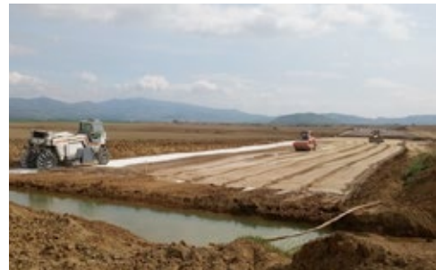
R2 Zvolen - Pstruša

po jej dokončení, ale aj polohou, kde sa realizuje a tiež náročnosťou realizácie čo do klimatických podmienok. Nemenej zaujímavá je stavba Galérie Lučenec, ktorú sme museli zrealizovať za krátky čas v zimnom období pri absencii kvalitných remeselníkov. Pre firmu je tiež dôležitá stavba z radov rýchlostných ciest a diaľnic a to je R2 Zvolen - Pstruša, ktorá je takým ďalším novým krokom smerovania firmy aj do tohto segmentu stavebnej činnosti. Nemenej dôležité sú tiež stavby kanalizácií a ČOV, ktoré sú v tomto období v záverečnej fáze realizácie.