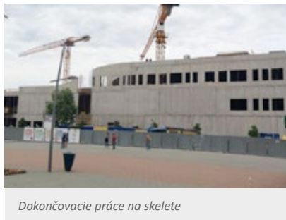
Dokončovacie práce na skelete

Našou úlohou bolo prakticky zrealizovať hrubú stavbu. Začínali sme teda od podkladových betónov, cez základovú dosku až po železobetónový skelet. Zo stavbárskeho pohľadu sú tunajšou špecialitou predpäté trámy, stropné dosky a stena na vrchnom poschodí. Bola to pre nás novinka, ja som to robil po prvý krát. Išlo vlastne o kombináciu napínacích lán, ich ukotvenia, injektáže a betónovania. Bolo to náročné na koordináciu a čas.