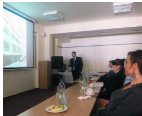
Prezentácia výsledkov hospodárenia

My si svoje ciele vždy presne definujeme, aby sme dokázali pri konečnom zúčtovaní