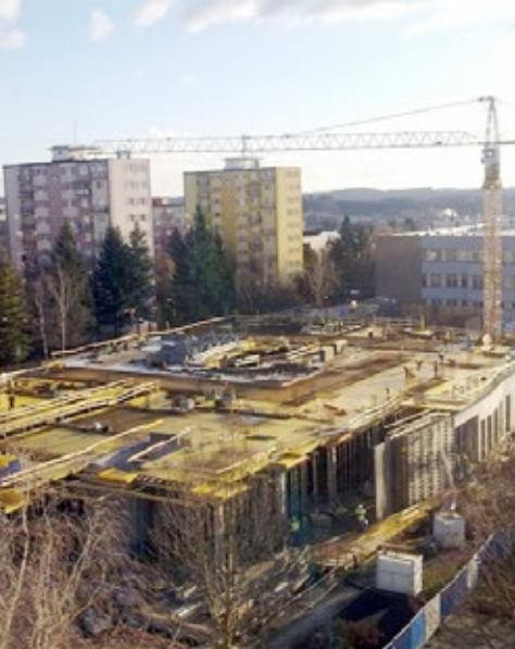
Ako na mravenisku