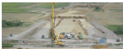
Rýchlostná cesta R2 Zvolen východ – Pstruša