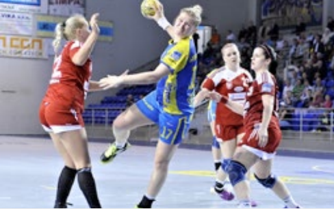
Triumf pred vlastným publikom

Hádzanáry získali v úvode roka už 3 cenné trofeje, čím najlepším možným spôsobom zviditeľňujú Chemkostav, ako generálneho partnera klubu.