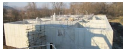
SKK Ružomberok a ČOV Liptovská Teplá, Liptovské Sliače