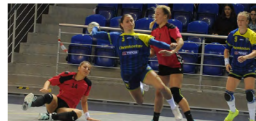
Prípravný zápas s Kisvárdou

Sú to všetko veľmi mladé, ale perspektívne hráčky. Držíme sa nastavenej filozofie v klube. Káder sme veľmi vhodne doplnili ako o slovenské tak aj zahraničné hráčky - tu hrajú prím hádzanárske z Čiernej Hory, s ktorými máme veľmi dobré skúsenosti. Sme si vedomí toho, že naše hráčky sú podľa prísnych európskych parametrov nižšieho veku a preto chceme hrať hádzanú založenú na aktívnom pohybe, ako v obrane tak aj v útoku. Čiže keď súper spraví 2 kroky tak my musíme urobiť 4. Toto bude náš štýl držať hru vo vysokom tempe, chceme dosiahnuť vysoký počet útokov s obrovským tlakom na súpera. Máme tomu prispôsobenú súpisťku a aj široké kádra, kde máme všetky posty adekvátne zdvojené.