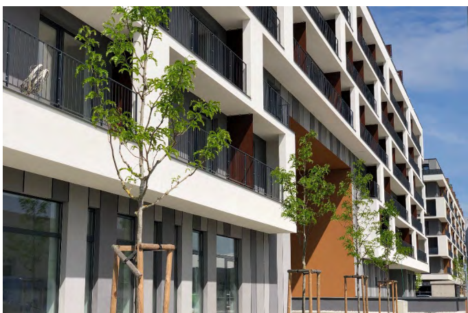
Projekt Južné mesto, Bratislava