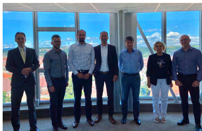
Zástupcovia investora a dodávateľa po podpise zmluvy