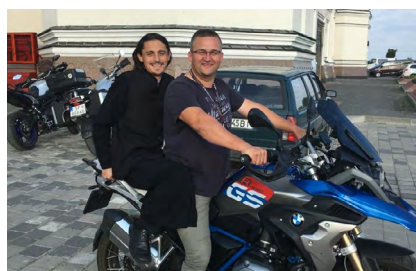
Na motorke s mníchom z kláštora v Počajeve (Ukrajina)

Prvú motoriku, ktorú som si zadovážil, bola ČZ 175 Manet. Bol to taký dobový skúter, ktorý pripomínal vaňu, vpredu mal veľké svetlo ako z Avie - ešte som na ňom učil aj manželku jazdiť. Okrem toho to neskôr boli rôzne Babetty a Simsony, na ktorých som sa neskôr učil techniku jazdy a radenie rýchlosti. Neskôr som už začal postupne skúšať silnejšie stroje, pretože som hľadal čo by mi najviac vyhovovalo. Mal som Hondu Shadow 750, potom Hondu 750 NC.