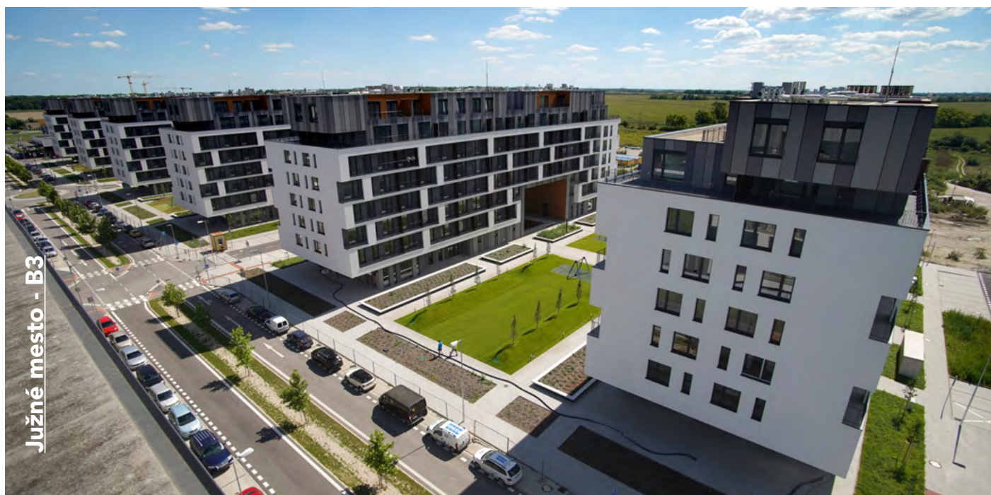
Južné mesto - B3