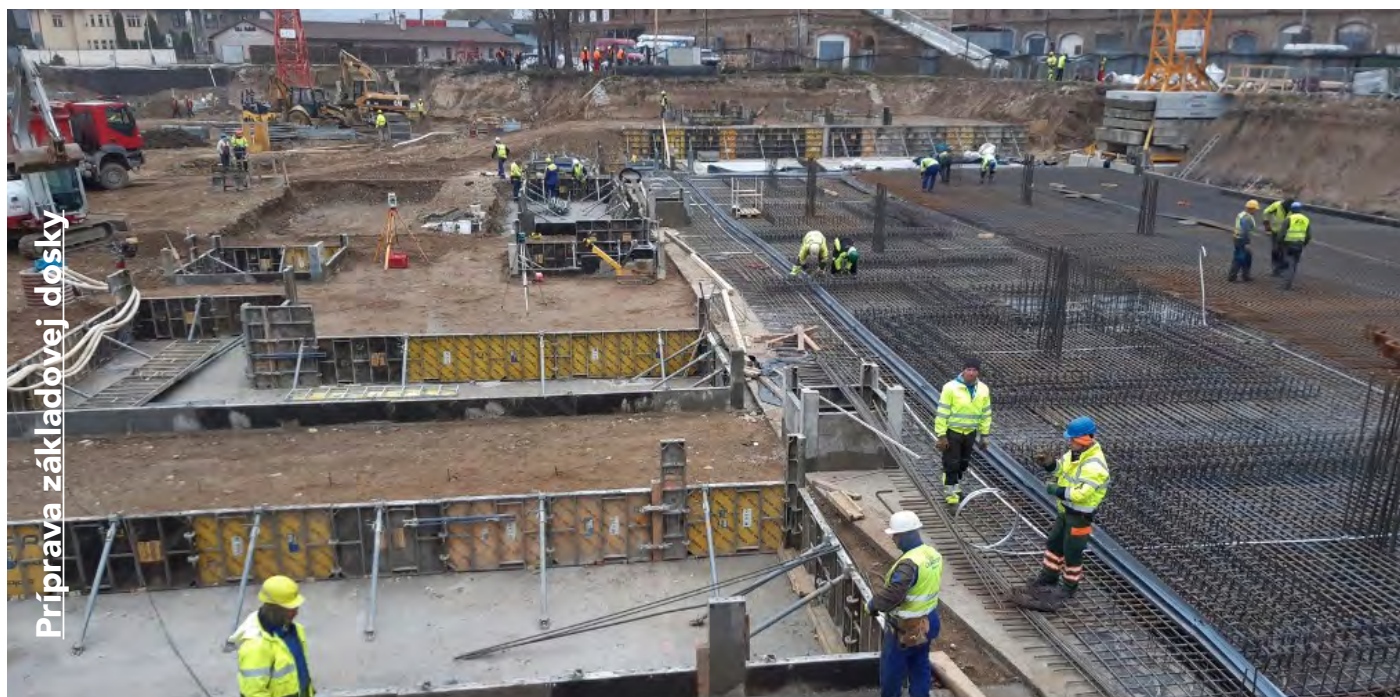
Príprava základovej dosky