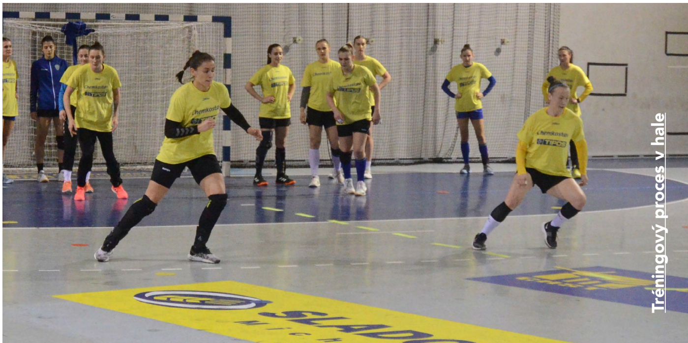
Tréningový proces v hale