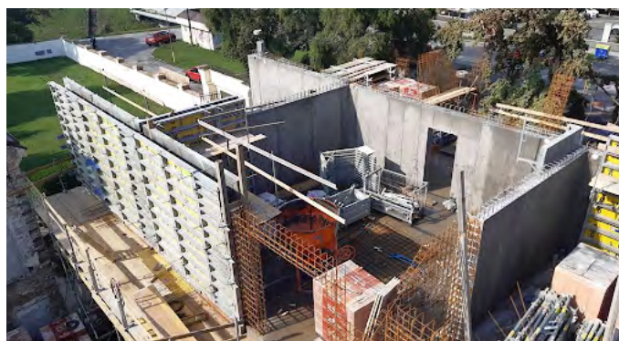
Polyfunkčný bytový dom ULIČKA v Trnave

Zväz stavebných podnikateľov Slovenska je nezávislá, dobrovoľná, nepolitická hospodárska a záujmová právnická osoba, ktorá vykonáva svoju činnosť ako organizácia zamestnávateľov. Združuje hospodárske podnikateľské subjekty pôsobiace v činnostiach súvisiacich so stavebníctvom.