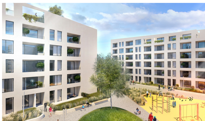
Obytný súbor Nová Trnava