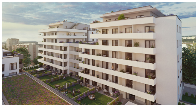
Residencia Albelli Košice

P: Som riaditeľom Divízie - Východ, čiže mám na starosti stavby na celom východnom Slovensku, ale aj projekty zasahujúce do stredného Slovenska. Personálne a odborne do mojej divízie spadajú stavbyvedúci, asistenti stavbyvedúcich, majstri, prípravári stavieb, skladové hospodárstvo, ako aj stavební robotníci jednotlivých profesií. V našej spoločnosti sú pracovníci, ktorí tu strávili väčšinu svojho pracovného života, ale snažíme sa vychovávať aj absolventov. Snažíme sa o to, aby boli naše stavby úspešné, naši zamestnanci a investori spokojní.