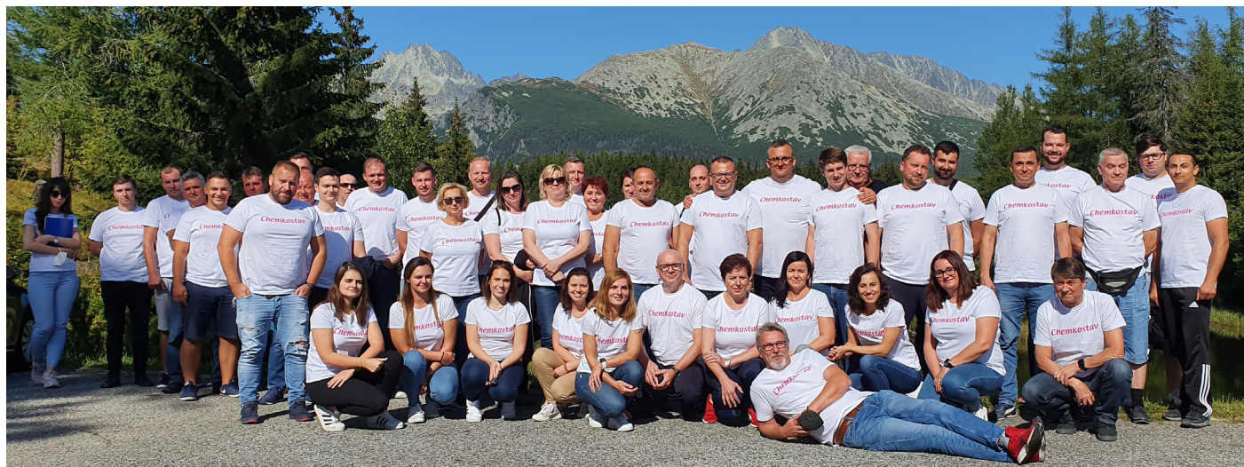
Kolektív Chemkostavu sa dňa 10.09.2021 zúčastnil teambuildingu vo Vysokých Tatrách. Od prezentácie dosiahnutých výsledkov spoločnosti za uplynulý rok sa prešlo ku športovým aktivitám, prechádzke po Štrbskom plese až po príjemné večerné posedenie.

(TASR) - Stavebná produkcia v eurozóne aj v celej Európskej únii (EÚ) v decembri 2021 medzimesačne aj medziročne klesla. TASR o tom informuje na základe údajov, ktoré v piatok zverejnil európsky štatistický úrad Eurostat. Podľa prvého odhadu Eurostatu sa stavebná produkcia v eurozóne po očistení od sezónnych vplyvov v decembri 2021 v porovnaní s novembrom znížila o 4 % v eurozóne a o 3,1 % v EÚ. V medziročnom porovnaní stavebná produkcia v decembri 2021 klesla o 3,9 % v eurozóne a o 1,8 % v EÚ. Za celý minulý rok stavebná produkcia v porovnaní s rokom 2020 vzrástla o 5,2 % v eurozóne a o 4,8 % v EÚ. Spomedzi členských štátov, ktoré Eurostatu dodali údaje za december, najväčší medzimesačný pokles produkcie v stavebníctve zaznamenali Rakúsko (-8,1 %), Nemecko (-7,3 %) a Francúzsko (-7 %) a najväčší nárast nahlásili Maďarsko (7,2 %), Švédsko (4,6 %) a Belgicko (3,2 %). V medziročnom porovnaní v decembri klesol najviac výkon stavebníctva v Nemecku (-13,6 %), Slovinsku (-6,4 %) a Rakúsku (-4,3 %). A naopak, jeho najväčší nárast bol zaznamenaný v Maďarsku (29 %), Taliansku (19,3 %) a Švédsku (9,6 %). Na Slovensku stavebná produkcia v decembri medzimesačne stúpila o 2,6 % a medziročne klesla o -1,8 %.