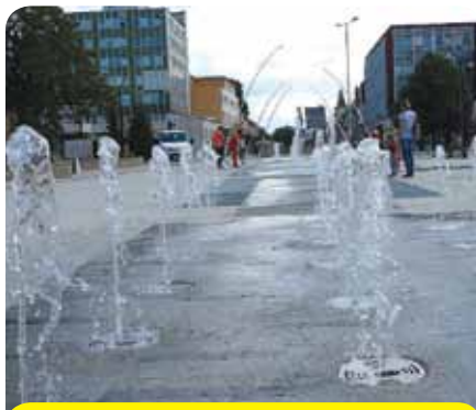
Novučičká chodníková fontána, ktorá užívanú vodu zároveň recykluje.

Pred desiatimi rokmi sa zrealizovala fontána lásky, tentokrát sme popracovali na zaujima-