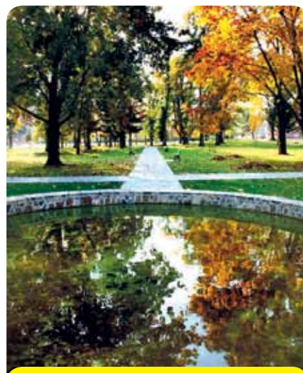
Vynovené centrum obce Stakčín: V jesenných mesiacoch sa je na čo pozeráť.