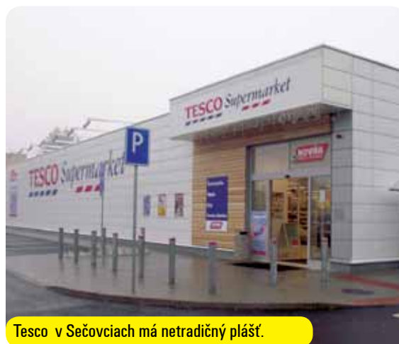
Tesco v Sečovciach má netradičný plášť.

diel oproti Gabčíkovu, kde sme stavali taký istý supermarket s fasádou z klasických trapézových plechov je ten, že tu sme už použili drevené kazety, čo už vyzerať podstatne lepšie s tým dreveným obkladom a hliníkovou fasádou“, vyjadril sa na adresu vonkajšieho plá-