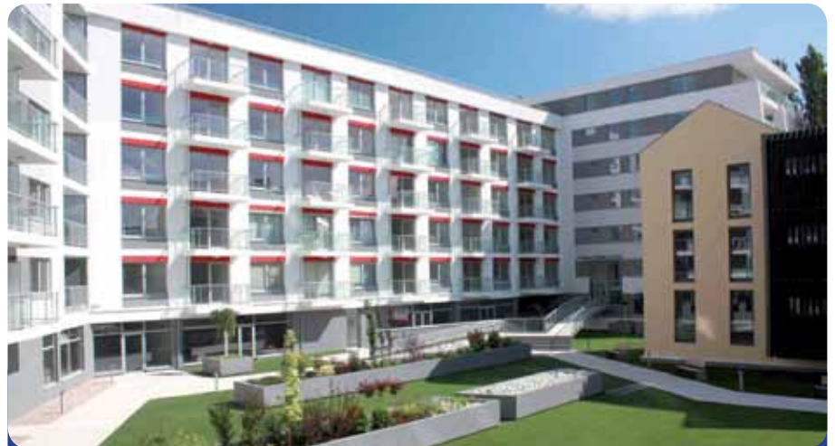
Bytový dom roka, rezidencia CASSOVAR v Košiciach.

Ako sme už spomínali, Rezidencia CASSOVAR súperila v uplynulom roku so silnou konkurenciou, avšak väčšina stavieb bola realizovaná na západe Slovenska. Ak by sme to rozmenili na drobné, komisia pre posudzovanie stavieb v súťaži Stavba roka 2011 pricestovala na východ Slovenska iba kvôli našim stavbám. O celom priebehu výstavby, až po prezentáciu