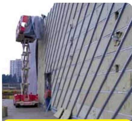
Zatepľovanie celého obvodového pláštú prebieha aj vďaka priaznivému počasiu.

Plocha, na ktorej nový hypermarket spolu s parkoviskom stojí, má rozlohu 8 870 m 2 . Na predajnú plochu pripadá 5 000 m 2 . Skladové priestory sú 3 000 m 2 . Len pre zaujímavosť, táto plocha sa rovná veľkosti predajnej plochy v Tescu Sečovce. Súčasťou objektu sú aj ná-