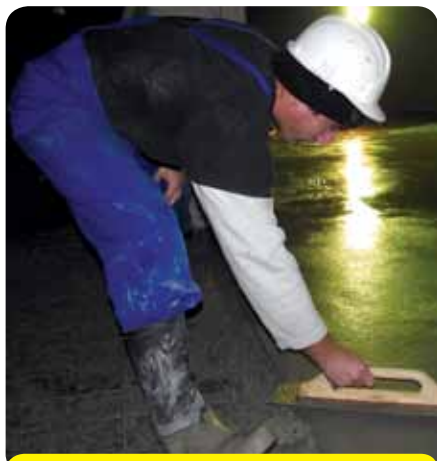
Pokládka betónových poterov v kryte CO.

štvtom nadzemnom podlaží máme postavené SDK priečky, ale zatiaľ iba z jednej strany, kto-