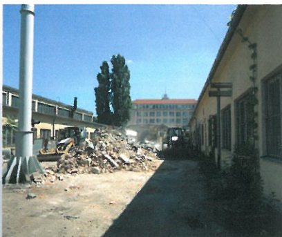
Technická univerzita v Košiciach

Naša spoločnosť prevzala stavenisko v areáli Technickej Univerzity v Košiciach, dňa 15.6.2012. Stalo sa tak potom, ako bola dňa 22.5.2012 medzi oboma stranami podpísaná zmluva o dielo.