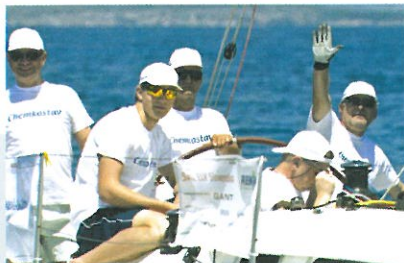
Posádka Chemkostavu, a.s., Michalovce

My sme to poňali v rámci užívaní vzťahov v kolektíve, minulý rok bola jedna zostava, tento rok pre zmenu úplne odlišná. Tým, že sme mali vlastného skúseného dvorného kapitána, netvorila sa u nás ponorková choroba a zároveň sa dodržiavali pravidlá. Mnohí majú predstavu, že jachting je len taká lážoplážo záležitosť, ale predsa len na otvorenom mori kde je hĺbka okolo 100 metrov a vietor poháňa loď rýchlosťou 7-8 uzlov je nutné kapitána počúvať na slovo. Mohlo by sa zaťiť stať, že niekto z posádky by mohol spadnúť z lode do vody a boli by to dosť dramatické chvíle. Našťastie sa nikomu nič nestalo.