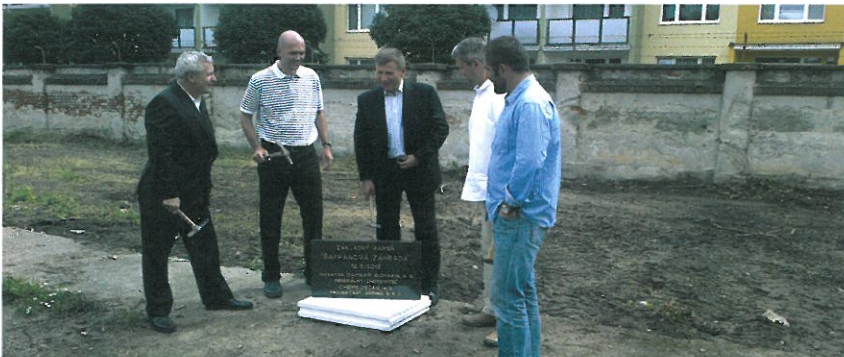
Základný kameň rezidence Šafranová záhrada

Naša spoločnosť prevzala stavenisko rezidenčného projektu bývania Šafranová záhrada v Košiciach, dňa 21.6.2012. Stalo sa tak potom, ako bola dňa