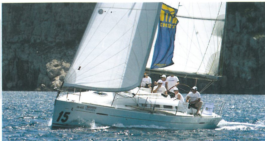
Jachtárske preteky TREND Regata 2012

Zástupcovia spoločnosti Chemkostav, a.s., Michalovce sa od 5. do 9. júna zúčastnili jachtárskych pretekov TREND regata 2012, ktoré sa konali na Jadranskom pobreží Chorvátska medzi mestom Split a ostrovmi Hvar a Vis.