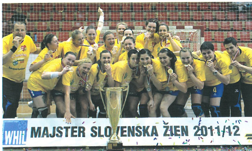
Majsterky Slovenska v hádzanej žien