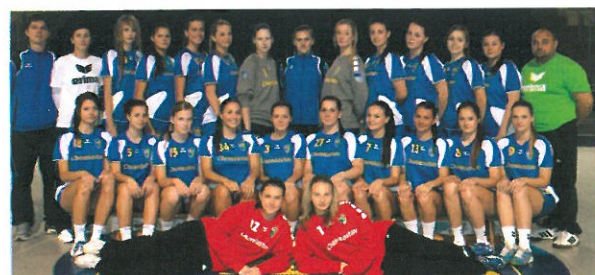
Družstvo junioriek a starších dorasteniek

Určite áno, veď Luventa má v každej vekovej kategórii zastúpenie aj v slovenskej reprezentácii. Hráčky sú rovnako v hľadáčkú aj trénera A družstva žien, ktorý pravidelne navštevuje zápasy mládežníckych kategórií. Už sa stihol vyjadriť, že viaceré z nich môžu byť v budúcnosti vhodnými posilami. Ich zaradenie do kádra žien ale musí prebehnúť postupne a nič sa nesmie uponáhľať.